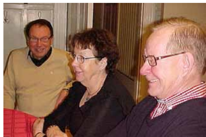
Nöjda gäster vid välbesökta juloottan i missionshuset