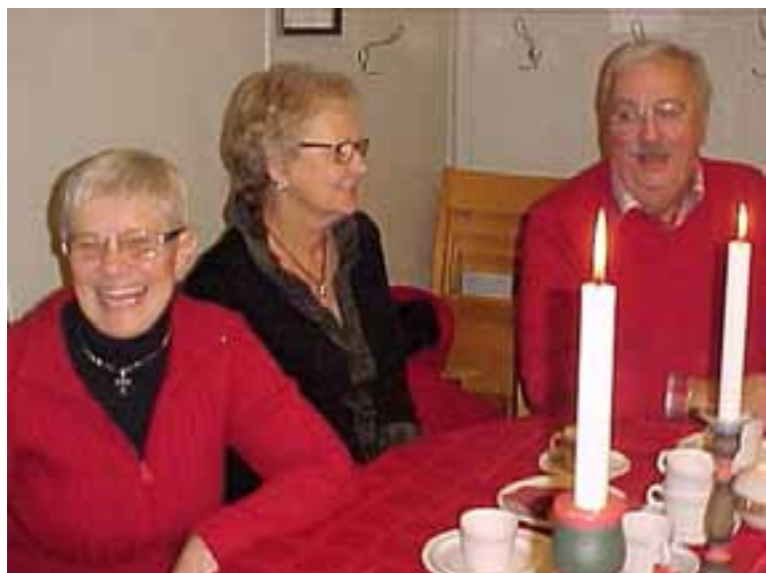
Glada julotte besökare vid fikabordet